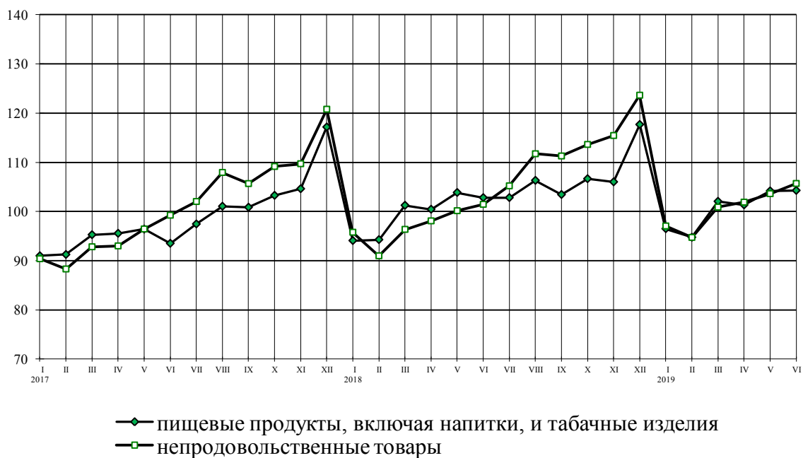
Динамика оборота розничной торговли пищевыми продуктами, включая напитки, и табачными изделиями, непродовольственными товарами в % к среднемесячному значению 2016 г.